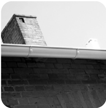
4. ja kourut (lisätietoja Caracol-asennusohjeissa)