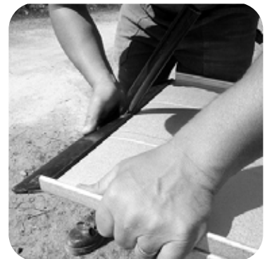
6. Tee 20 mm:n levyinen tasasaumapellin päähän, riippuen mihin suuntaan haluat aloittaa asentamisen. Käytä tähän taivutustyökaluamme.