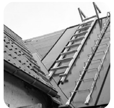
9. Jos käytät sisäjiirilistoja, niiden tulee aina olla ehjällä pinnalla. Käytä sisäjiirilistan ja Easy-Click-pellin välissä tasasaumaa.