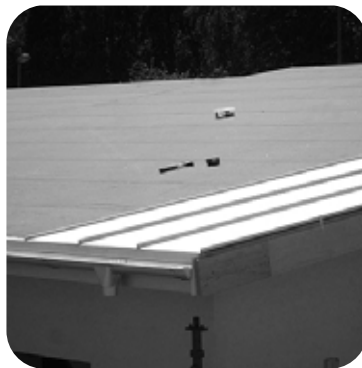
8. Aseta seuraava pelti paikalleen ja säädä peltejä varovasti siten, että niiden alareunat ovat kohdakkain. Paina pellin pontti paikoilleen räystäästä katonharjaan.