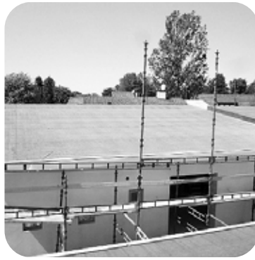
2. tai tasaiselle alustalle