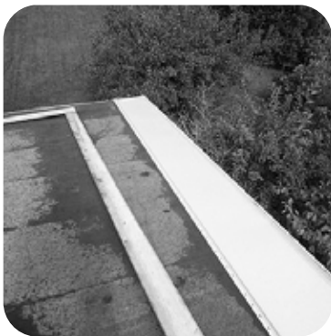
7. Aseta ensimmäinen pelti kattopinnan reunaan ja tarkista, että pelti on oikein kohdistettu siten, että seuraavat pellit tulevat oikeaan asentoon. Kiinnitä ensimmäinen Easy-Click-pelti kiinnitysruuveilla.