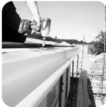
5. Kiinnitä räystäät sinkityillä piikeillä tai kiinnitysruuveilla.