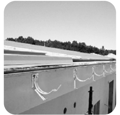
3. Aloita asentamalla vesikourun kannakkeet