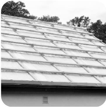
1. Asenna ruoteille