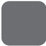
Grafiitinharmaa RAL 7024