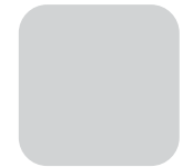
Sinkitty Z 275