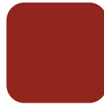
Viinipunainen RAL 3009