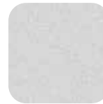
Hopea RAL 9006