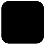
Musta RAL 9005