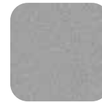
Alumiinisinkki AZ 185