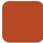
Tiilenpunainen RAL 8004